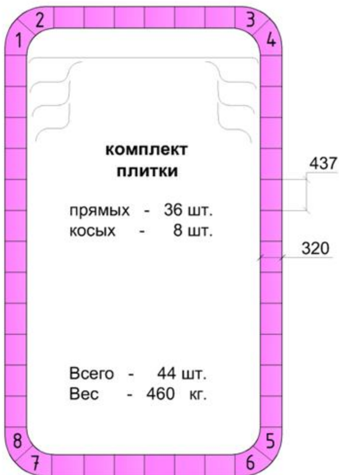
СХЕМА укладки композитного бордюрного камня модель бассейна "Бордо"